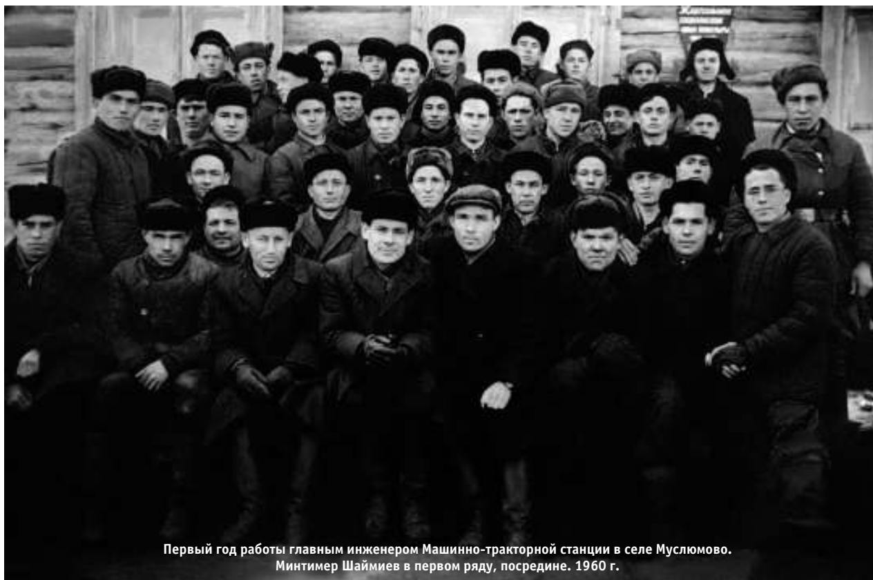
Первый год работы главным инженером Машинно-тракторной станции в селе Муслимово. Минтимер Шаймиев в первом ряду, посредине. 1960 г.

седателем колхоза? Надо отдать должное односельчанам – несмотря на грубую агитацию, у них хватило смелости поручить свою судьбу человеку основательному, умеющему вести хозяйство. Это, безусловно, удивительный случай: быть избранным председателем колхоза в молодом возрасте и почти на всю жизнь. В 1941 году он сражался под Москвой, был тяжело ранен в правую руку. И в 42-м, через год с лишним, его демобилизовали, отправили как инвалида войны домой. Он приехал, и его сходу опять сделали председателем. Так он и проработал в этой должности 26 лет. Отец, конечно же, был человеком своего времени, дорожил тем, что он член КПСС, и требовал, чтобы с нашей стороны не было никаких серьёзных проступков. Он не хотел, чтобы его могли упрекнуть в чем-то и напомнить о «кулацком» прошлом.