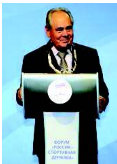
Вручение Минтимеру Шаймиеву Олимпийского ордена.

на посту президента республики – я всегда давал полную свободу действий кабинету министров. Наш нынешний президент Рустам Минниханов 11 лет проработал премьер-министром и знает, что только в нашей республике молодые руководители пользуются такой самостоятельностью. Мой уход – это естественный процесс смены поколений, и проблем с преемником у нас не было, так как уже имелся подготовленный человек с командой работоспособных министров, руководителей республиканских ведомств, районов и городов.